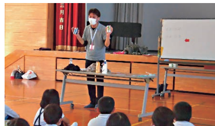
ユニバーサルデザインの日用品、 どんなものがあるかな？