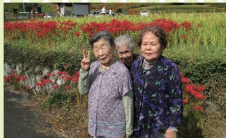
【ヒガンバナのきれいかねー】