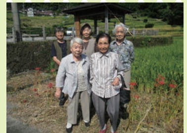
【江里山の空気は気持ちよかー】