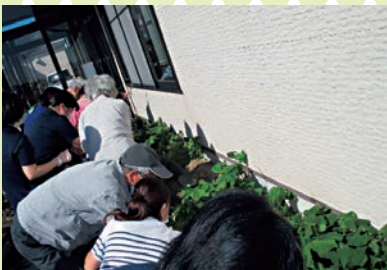
【どれくらい大きくなってかな？】

6月に植えたさつまいが収穫の時期を迎えましたので、10月7日に実習に来ていた西九州大学看護学生の皆さんと一緒に芋掘りをしました。収穫したお芋を蒸かして皆さんと美味しくいただきました。今後は白菜を植える予定にしています。また、季節も秋らしくなり、バスハイクで江里山のヒガンバナを見に行きました。棚田のヒガンバナは丁度見ごろで喜んでいただきました。