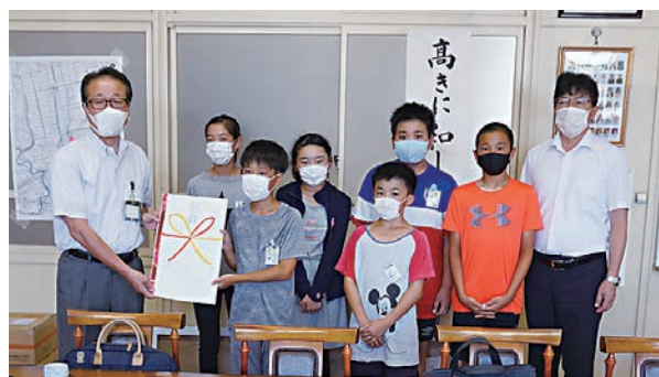
(募金を呼びかけた牛津小学校の5・6年生)