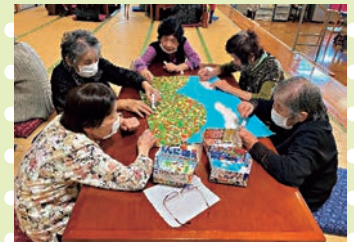
【ちぎり絵できれいか紅葉ば作ろうね！】