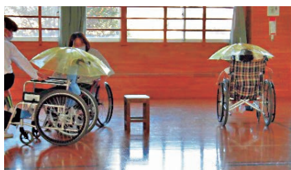
傘を差しながら車いすの操作は大変！