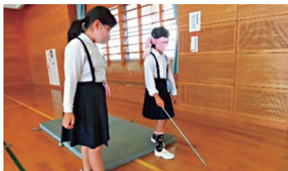
ゆっくり安全に体験します。