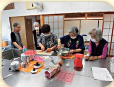
ホウ酸団子づくり