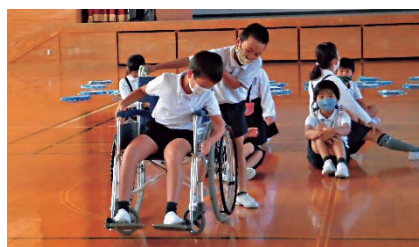
車いすの操作は難しいな。