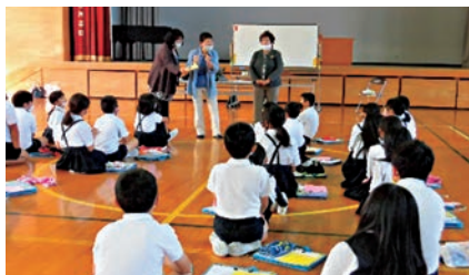
地域の方にもご協力いただいています。

市民ボランティアセンターでは小城市内の小学校、中学校から依頼を受け、福祉に関する講話や車いす、アイマスクを使った障がい者の生活の体験を通じて児童・生徒の「福祉」に関する学びをお手伝いしています。