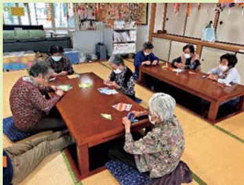
【みんなで頑張って、上手にコスモスの花が出来上がったよ！】

11月に開催された小城市民文化祭の作品づくりを行いました。今回はちぎり絵と折り紙を組み合わせ、コスモスと紅葉を広用紙に貼り付けて作成しました。 皆さんで協力して綺麗な作品が出来上がりました。