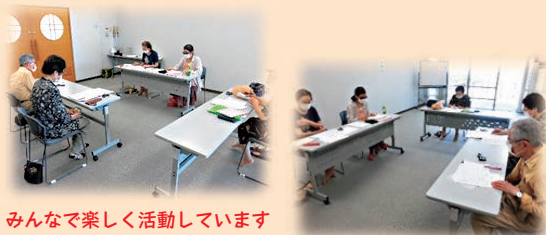
みんなで楽しく活動しています

自分で考えた短歌を参加者みんなで披露しあいそれぞれ感じたこと、思ったことを話し合いながら添削しています。一緒に短歌を楽しむ仲間を募集中です。