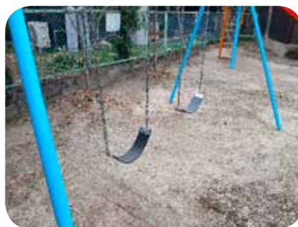
三日月町 江利区 ブランコ補修