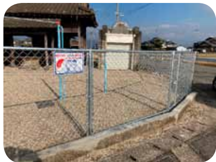
芦刈町 道免区 フェンス新設

小城市社会福祉協議会では、児童の健全育成に寄与することを目的として、区が管理する児童遊園地の遊具・フェンスに対する新設、補修、撤去に対して経費の一部を共同募金より助成しています。今年度は、新設2地区・補修2地区に助成を行いました。