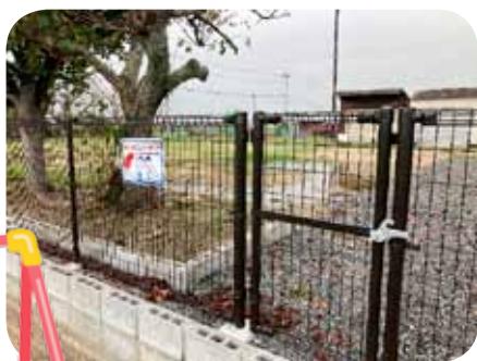
芦刈町 三条区 フェンス新設