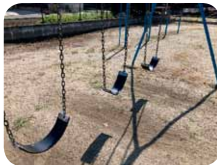
三日月町 初田区 ブランコ補修