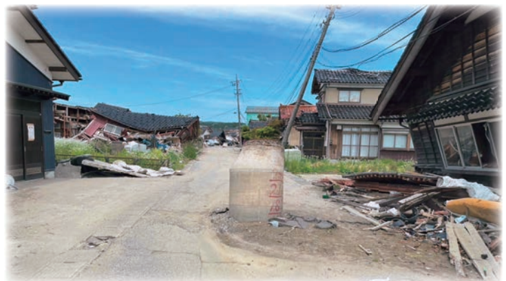
【道路から隆起したマンホール】