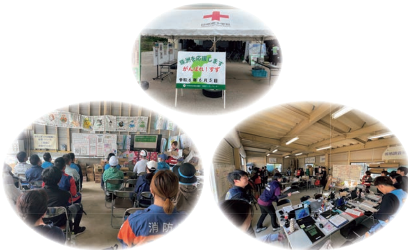
【珠洲市災害ボランティアセンター】

この度の能登半島地震により被災された方々へお見舞いを申し上げますとともに、一日も早い復興・復旧を心からお祈りいたします。