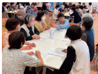
研修会ではそれぞれの思いを ざっくばらんに話し合いました。