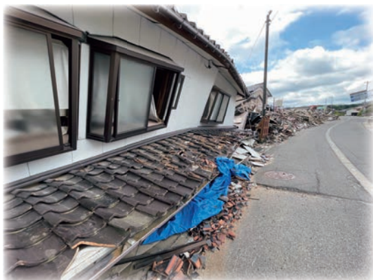
【津波の被害が大きかった地区】