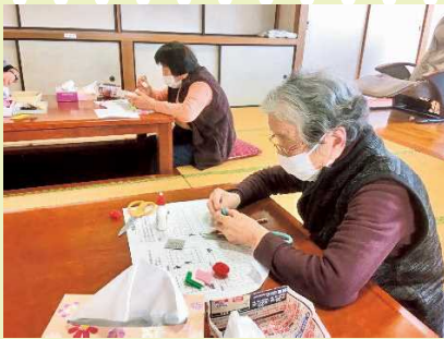
【ボンドやハサミを慎重にを使って上手に作らねばね～】