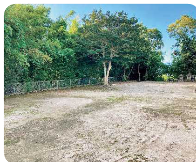
芦刈町 舎人区 遊具撤去