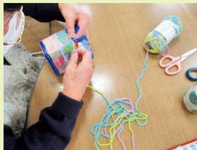
【面を間違えてないかしら～?】