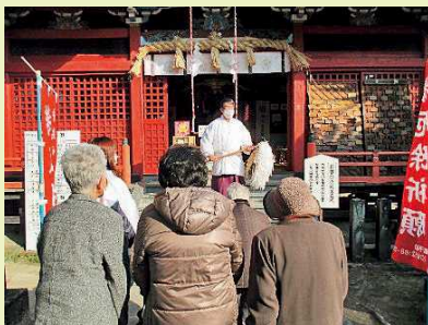
【健康で過ごせますように!!】