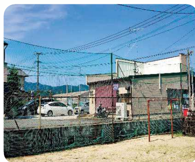
三日月町 甘木区 フェンス補修