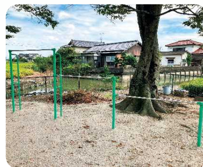
芦刈町 浜中区 砂・鉄棒補修