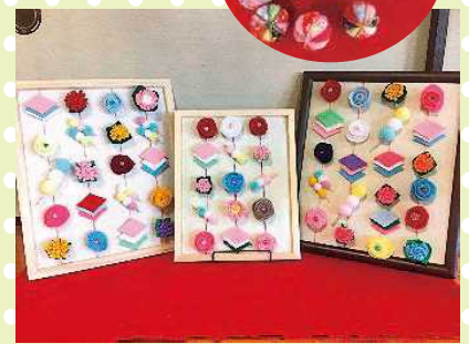
【綺麗な作品が完成しました!!】