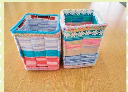
【カラフルな小物入れが出来ました!】