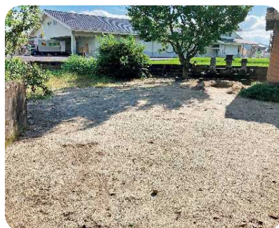
小城町 横町区 遊具撤去