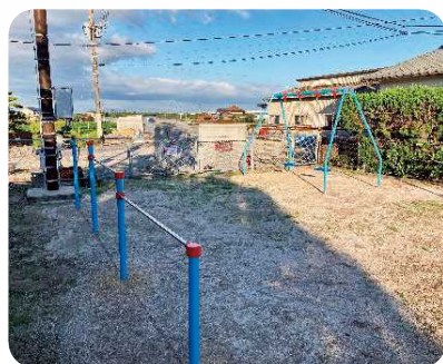
芦刈町 住の江西区 鉄棒・ブランコ新設

小城市社会福祉協議会では、児童の健全育成に寄与することを目的として、区が管理する児童遊園地の遊具・フェンスに対する新設、補修、撤去に対して経費の一部を共同募金より助成しています。今年度は、新設1地区・補修2地区・撤去2地区に助成を行いました。