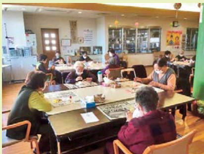
【良い一年になりますように！】