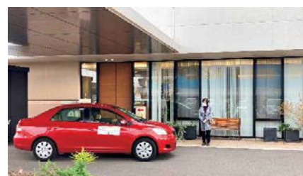
付き添い支援 (病院への付き添い)