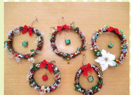
【鮮やかなリースの出来上がり～！】