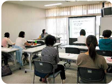
「小児看護の基礎知識」