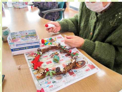
【飾りの位置はここでいいかしら】