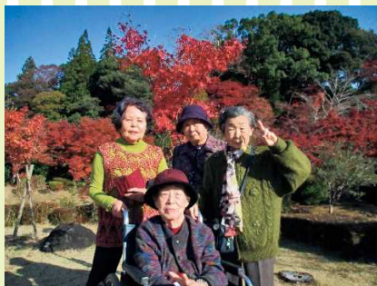
【見頃でとってもきれいだったね～】

12月はクリスマスツリーの制作を行いました。細かい飾りを、ボンドなどでリースに付けていく作業は難しくて根気がいりましたが、皆さん頑張って、色とりどりの鮮やかなリースが出来上がりました。