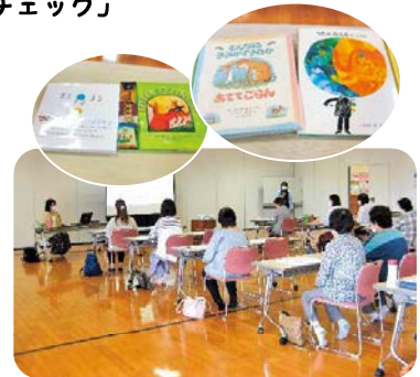
「絵本の読み聞かせの大切さ」