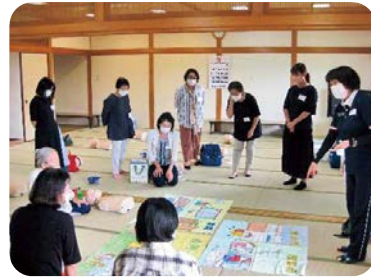
「危険な場所チェック」