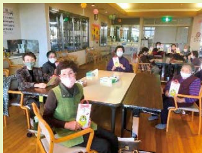
【みんな上手に寅年の飾り物が出来上がったよ！】