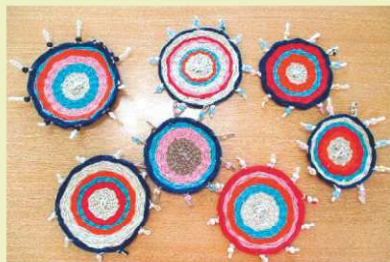
【色んなコースターが出来ました!!】