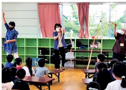
きらく会(三日月小学校)