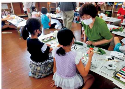
絵手紙野菊の会(芦刈観瀾校)

夏休み期間中の各町の放課後児童クラブで、子ども達と一緒に様々な活動を行いました。子ども達も笑顔いっぱい、元気いっぱいでした。