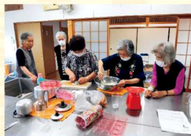
ホウ酸団子づくり