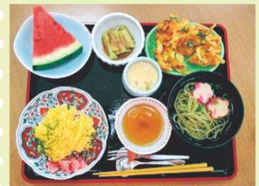
【食欲をそそる味付けでしたね!!】