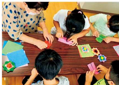
折り紙おりづるの会(牛津小学校)