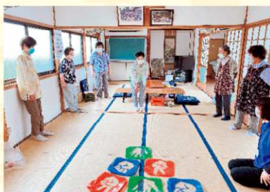
レクリエーション

また、自主的にサロンを開催される地区には、助成金制度もありますので下記までご相談ください。