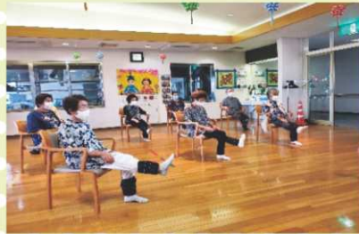
【足ばあげて筋力ばしっかいつけんば!!】

介護予防の一環として、毎回午前中に健康運動指導士の方が来られ、運動や体操の指導を受けています。何歳になっても筋力を維持することを目標に頑張っており、重りを使ったり、全身を動かす体操を行っています。利用者の皆さんからは「家ではなかなか体操とかせんばってん、デイサービスに来ると必ず出来るよね〜」「ひまわりに来て身体ば動かしよかんば、足の弱ってしまうもんね」という話をされ、毎回真剣に取り組まれています。