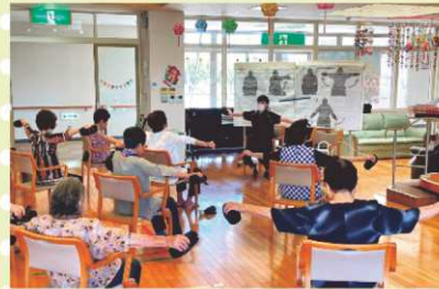
【肩の運動もしっかり!!】