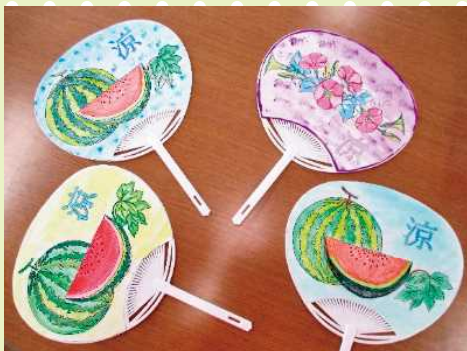
【見ているだけで、涼しいわね!!】

きららでは夏の暑さを乗りきるため、手作りのうちわを制作しました。彩り豊かな作品に仕上がり、皆さん喜ばれていました。畑では夏野菜を作っており、大きく育ったら皆さんと一緒に食べたいと思います。毎年、季節を感じられる行事を行い、皆さんに楽しんでいただいています。