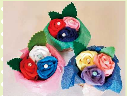
【きれいなバラの花が完成しました！】