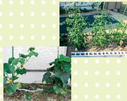
【ミニトマト早く真っ赤になーれ!!】