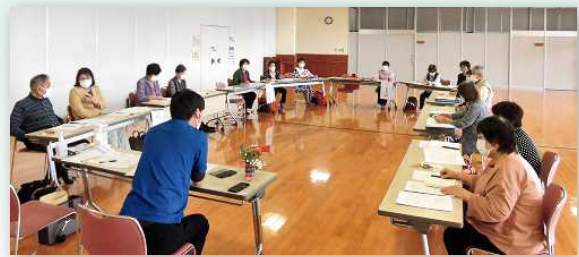
少人数で行いました。