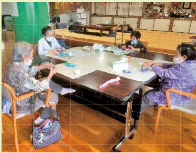
【初めて作ったばってん、上手に作れたよ〜！】

5月は創作活動でフェルトを使ったバラ作りに挑戦しました。皆さん手先を器用に使われ、和気あいあいとお話を楽しみながら作られていました。作品が完成した際に「上手に出来上がったね」「こがんと初めて作ったよ」と、皆さん喜ばれていました。