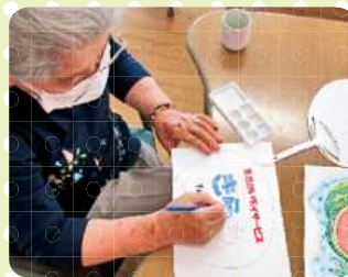
【美味しく見えるかなあ〜!!】