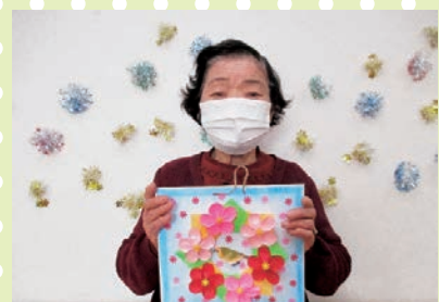
【可愛い壁掛けが出来ましたよ〜】