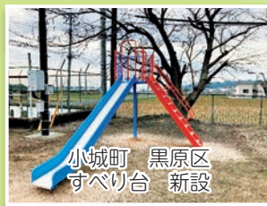
小城町 黒原区 すべり台 新設

小城市社会福祉協議会では、児童の健全育成に寄与することを目的として、区が管理する児童遊園地の遊具・フェンスに対する新設、補修、撤去に対して経費の一部を共同募金より助成しています。今年度は、新設5地区・撤去2地区に助成を行いました。