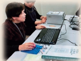
録音したデータを CDに吹き込みます