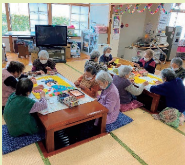
【それぞれ自分の持ち場で頑張って作業されています！】

作品が完成した際に「上手に出来上がったね」「こがんと初めて作ったよ」と、皆さんで喜ばれていました。