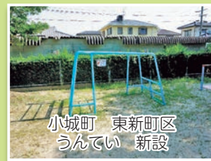
小城町 東新町区 うんてい 新設