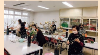
思い思いに生けていきます。

花は人を癒し元気にする効果があり、見ると癒しのひと時となり、生活が華やぎます。 講座では自分の感覚で生けながら、先生からのアドバイスも受けることができます。 初心者の方、大歓迎です。参加してみませんか?