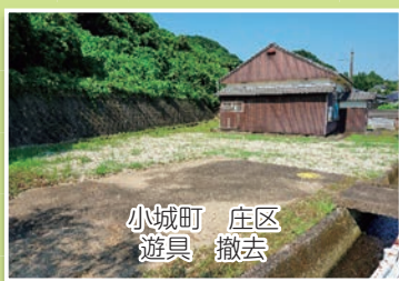
小城町 庄区 遊具 撤去