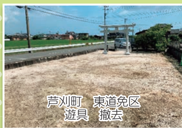
芦刈町 東道免区 遊具 撤去