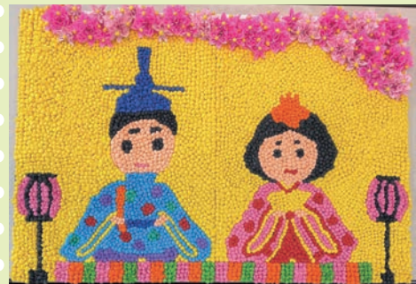
【皆さんで協力して大作が出来上がりました！】