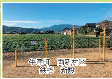
牛津町 両新村区 鉄棒 新設