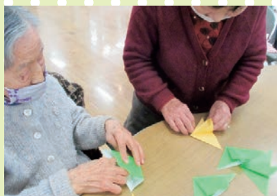
【折り紙を折ると昔を思い出すわねえ】