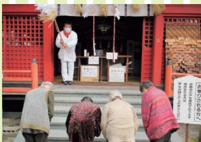
【願いが叶いますように!!】

創作活動では、梅の花の壁掛けを作りました。悪戦苦闘しながらも一生懸命取り組み、出来上がると「きれいにできたね」と皆さん喜ばれていました。