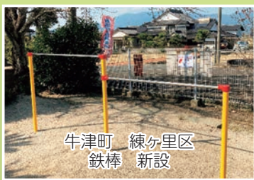
牛津町 練ヶ里区 鉄棒 新設