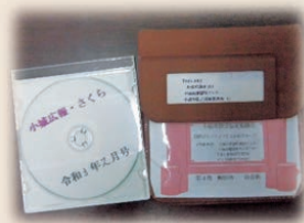
お送りしたCDは利用者へ プレゼント