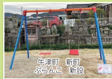
牛津町 新町 ぶらんこ 新設