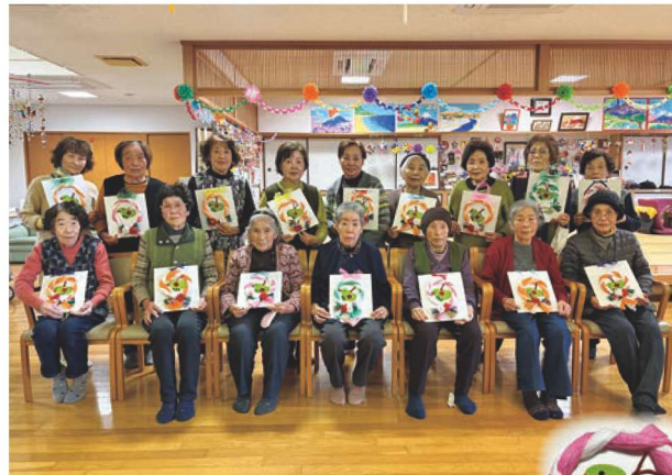
今年の干支「巳」を 利用者全員で作りました