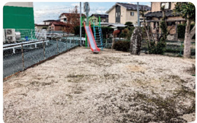
芦刈町 永田区 ブランコ撤去