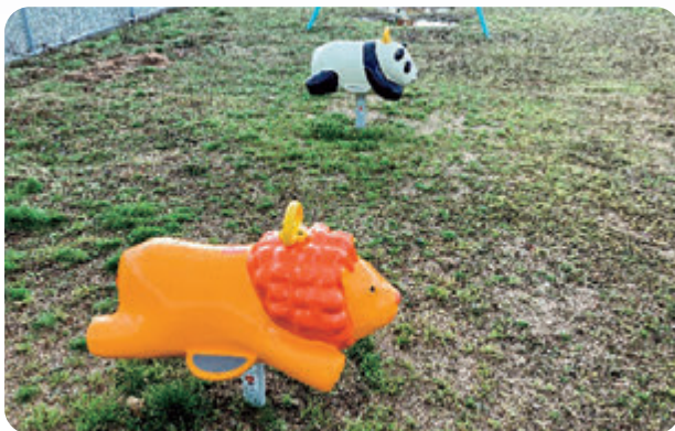
三日月町 西分区 遊具新設

小城市社会福祉協議会では、児童の健全育成に寄与することを目的として、区が管理する児童遊園地の遊具・フェンスに対する新設、補修、撤去に対して経費の一部を共同募金より助成しています。今年度は、新設1地区・撤去1地区に助成を行いました。