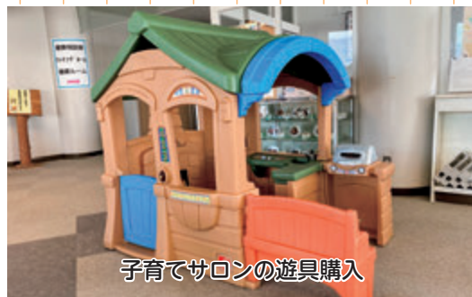
子育てサロンの遊具購入