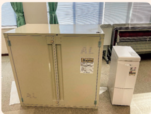
米保管庫・冷蔵庫