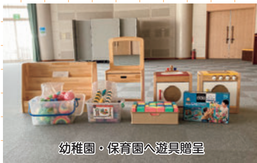
幼稚園・保育園へ遊具贈呈