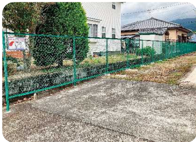
三日月町 長神田区 フェンス新設

小城市社会福祉協議会では、児童の健全育成に寄与することを目的として、区が管理する児童遊園地の遊具・フェンスに対する新設、補修、撤去に対して経費の一部を共同募金より助成しています。今年度は、新設2地区・補修2地区・撤去1地区に助成を行いました。