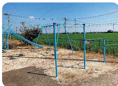
三日月町 吉原区 遊具補修