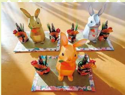
(ご健康を祈念し心を込めて作りました!!)

新年早々、寒波が到来し寒い日が続きましたが、きららの皆さんは元気にお過ごしです。皆さんが、今年一年間、健康で元気にお過ごしいただきますようにと、年末に職員手作りの干支の兔をプレゼントさせていただきました。また、2月の創作活動では梅の花のリース作りを行いました。花の配列などを考えながらボンデで綺麗に飾り付けられました。