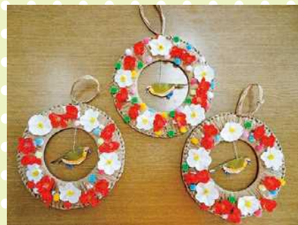
(早く春が来てほしいですね〜!!)