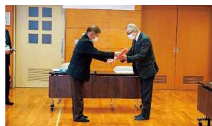
（御厨会長から江里口市長へ任命）