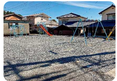
小城市 江里口区 遊具補修