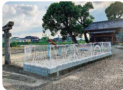
芦刈町 西戸崎区 フェンス新設