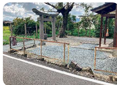
牛津町 友田区 遊具撤去