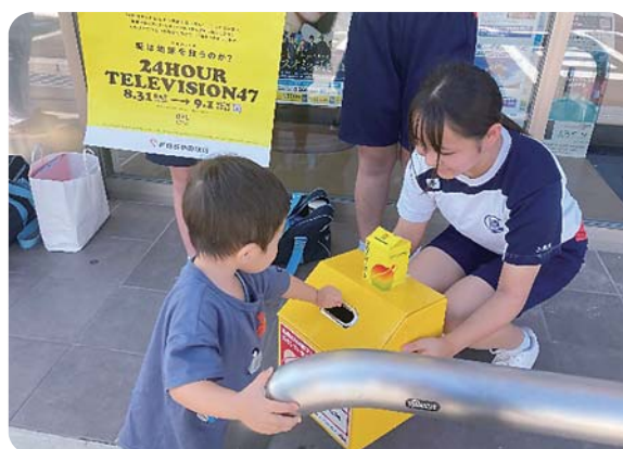
芦刈観瀾校 中学部