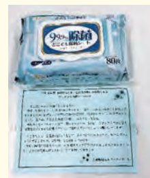
配付した除菌シート