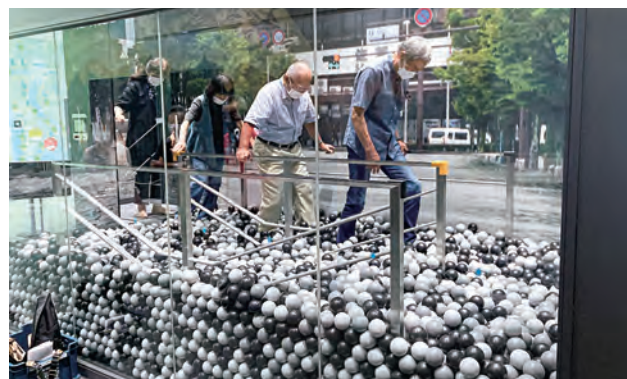
佐賀防災学習広場「泥水歩行体験」