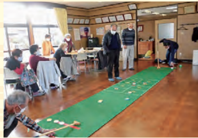
レクリエーション

また、自主的にサロンを開催される地区には、助成金制度もありますので下記までご相談ください。