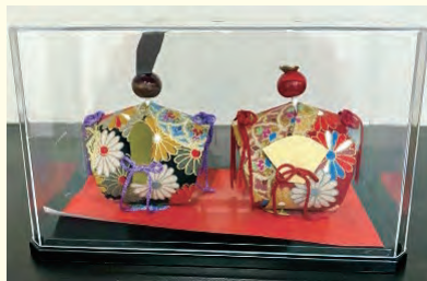
手作りしたお雛様