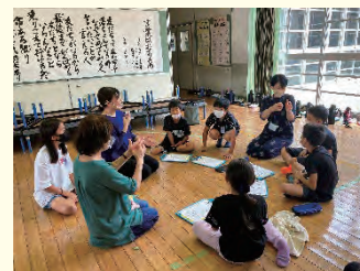
学校での手話学習