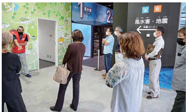
佐賀防災学習広場「佐賀マップ」