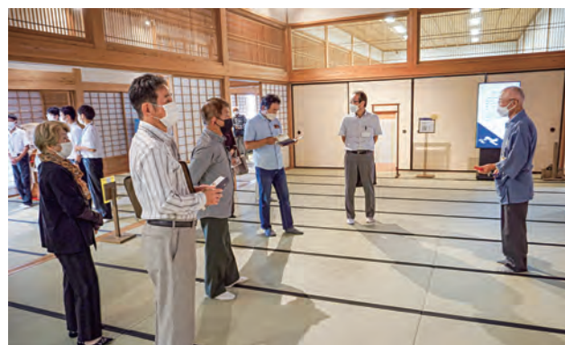
佐賀城本丸歴史館「外御書院」