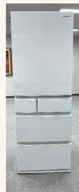
食糧保管用冷蔵庫