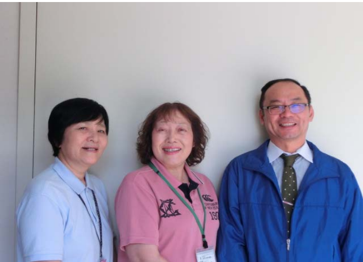
笑顔と思いやりの気持ちを大切にしています!!

住み慣れた環境の中で、自分らしく より豊かな人生を過ごしていただくことが、 私たちの願いです。